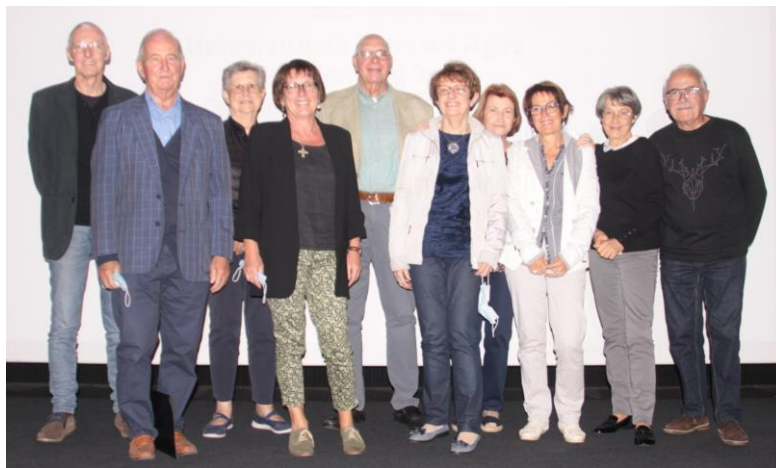
Les nouveaux membres du bureau élus le 01/10/21.